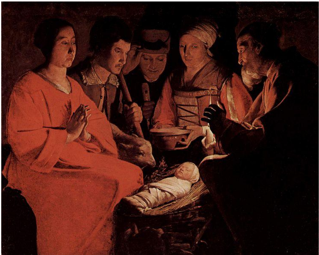
« L'Adoration des Bergers » 1644 Huile sur toile Dimensions 107 × 137 cm

Georges de la Tour Musée du Louvre Paris