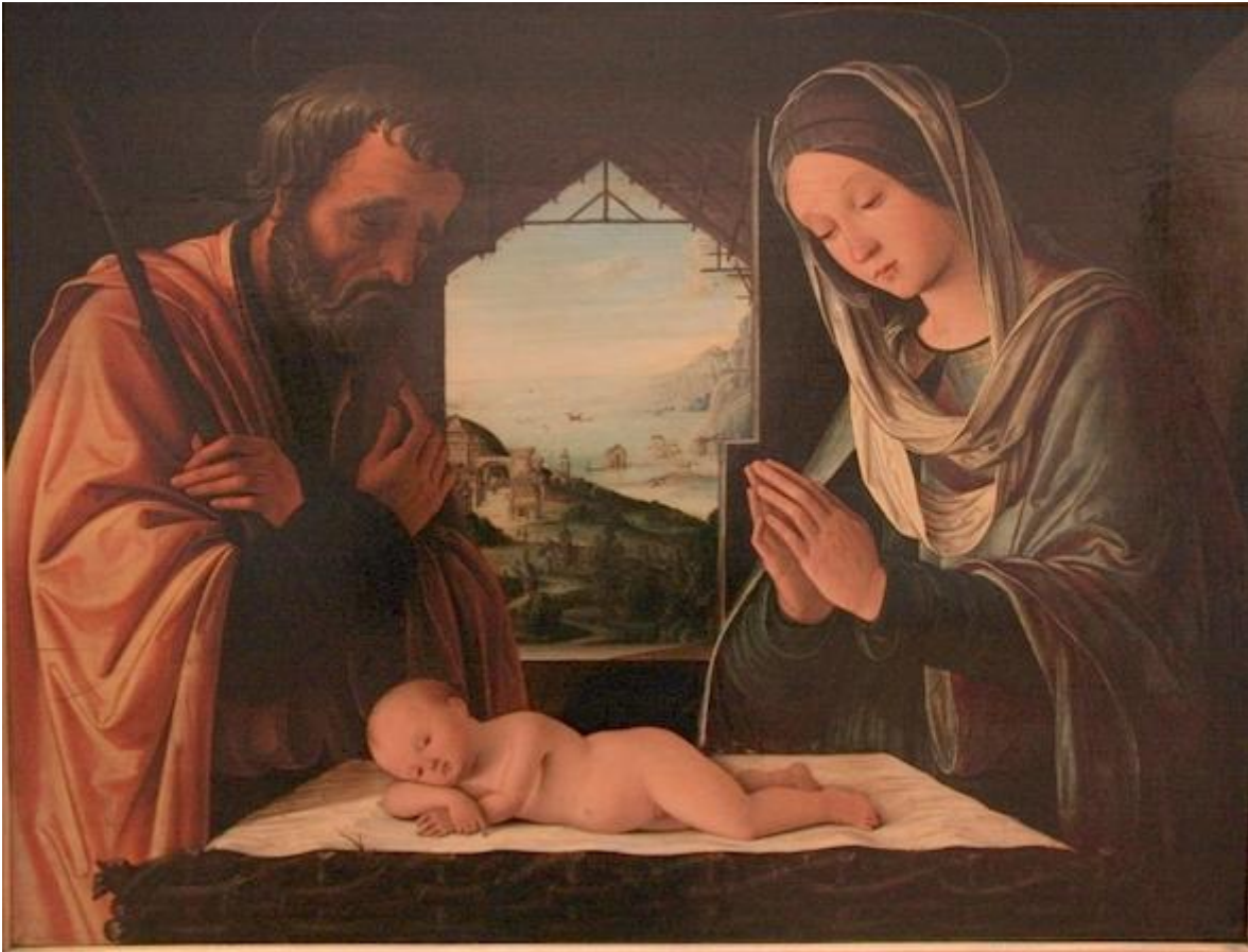
La Nativité de Lorenzo Costa - vers 1490 (Musées des Beaux-Arts de Lyon)

3) Quelles teintes sont utilisées ? Pourquoi ?