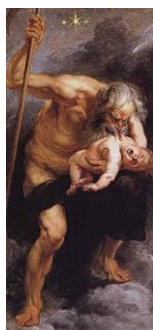
Le dieu « Saturne » d'après Rubens