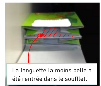
La languette la moins belle a été rentrée dans le soufflet.

Étape 4 - Dernière étape ! Plie à nouveau la brique comme lors de l'étape 2, et rentre la languette (qui dépasse au milieu de ta brique) dans ce qui sera le 1er soufflet de ton porte-monnaie. Si la languette est trop large pour rentrer dans le soufflet : n'hésite pas à lui donner quelques coups de ciseaux !